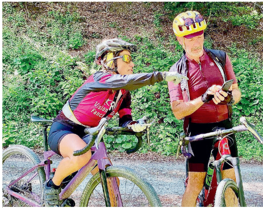
Umbria&Bike, alla scoperta degli angoli più inediti della regione: da Città di Castello al Tevere, sulla via di Francesco / GoCycling