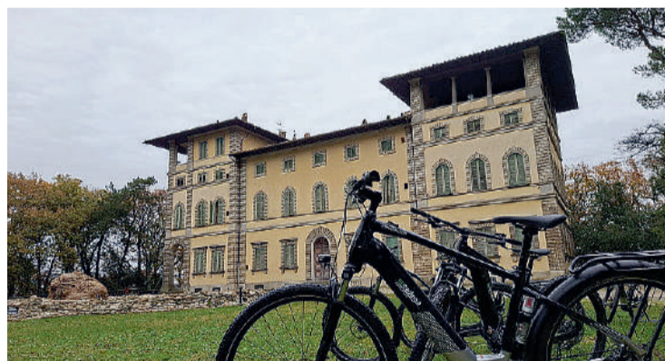
Villa Montesca a Città di Castello

cretti, le monumentali tavole di colori con i materiali i più diversi. Un luogo che sorprende, quasi spiazzante per quanto è bello, e racconta un'altra identità della città. Salendo delle ripide scale di un palazzo di Corso Cavour, si apre un altro mondo e ci si può tuffare in un passato che resiste: la stampa della Tipografia Grifani Donati, attiva dal 1799. Un luogo vivo di un'arte antica, che al tempo del digitale, dei social e dell'ia, sa ancora affascinare, e insegnare il valore di imprimere delle let-